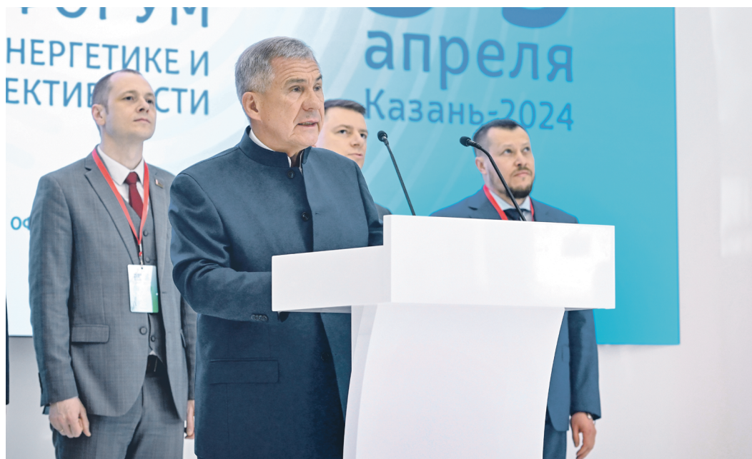
Церемония открытия ТЭФ-2024 прошла в Международном выставочном центре «Казань Экспо», старт мероприятию дал Раис Татарстана Рустам Минниханов

С 3 по 5 апреля в Казани проводился Татарстанский международный форум по энергетике и энергоэффективности (ТЭФ-2024), который традиционно прошел при поддержке Правительства России. Его организаторами выступили Министерство промышленности и торговли Татарстана, Центр энергоэффективных технологий РТ и АНО «Казань Экспо».