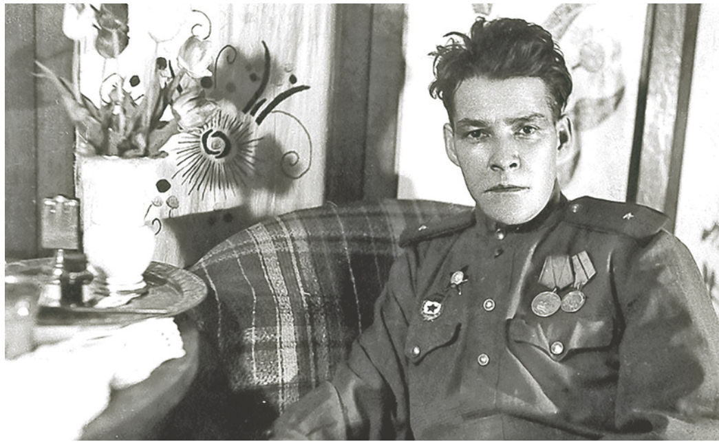
Он написал стихи, пьесы, повести, романы. А его повесть «Неотосланные письма» переведена на 40 языков

Административное здание Общества «Газпром трансгаз Казань», расположенное в Казани, находится на улице, которая носит имя знаменитого татарского писателя и поэта Аделя Кутуя.